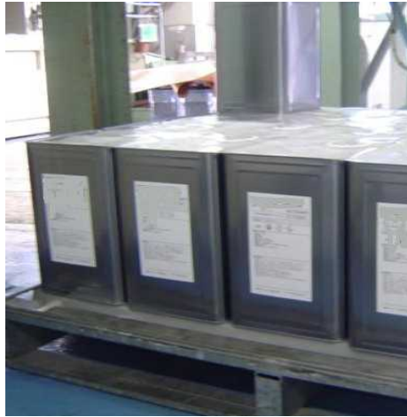
フィルム両面NS…一斗缶の滑り止め