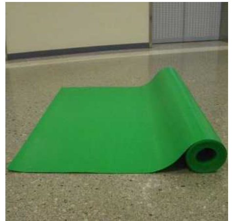
ブラベニソフトNS(EVA)…ロールタイプ