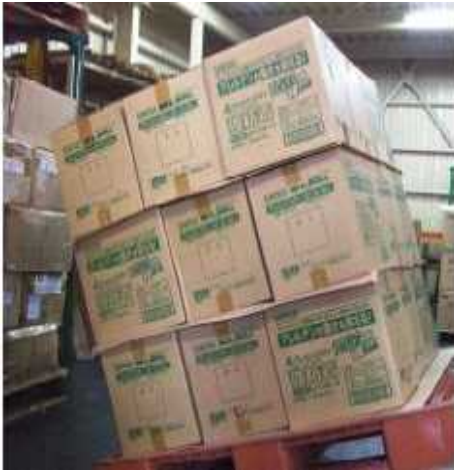
クラフト両面NSシート…荷物の合い紙