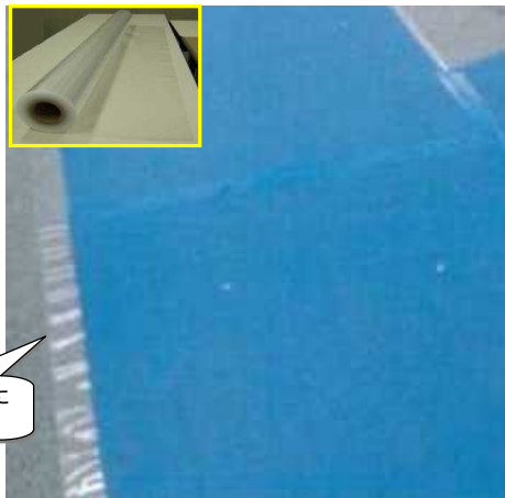
フィルム両面NS(長尺品)…養生板の滑り止め